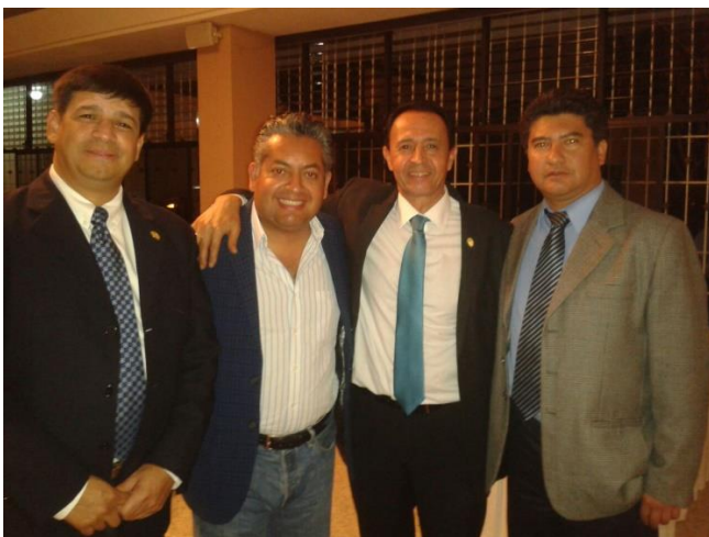
Participación en el Miércoles científico del CEG y promoción del congreso FOCAP