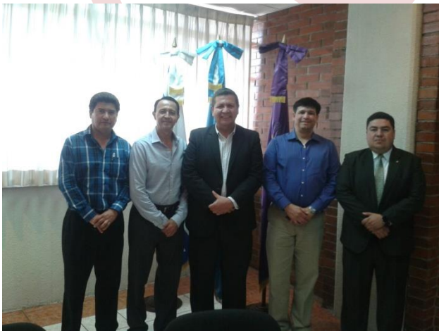
Reunión con el Claustro de profesores de la FOUSAC

Reunión con el Decano y el Concejo Académico de la Facultad de Odontología de la Universidad de San Carlos de Guatemala.